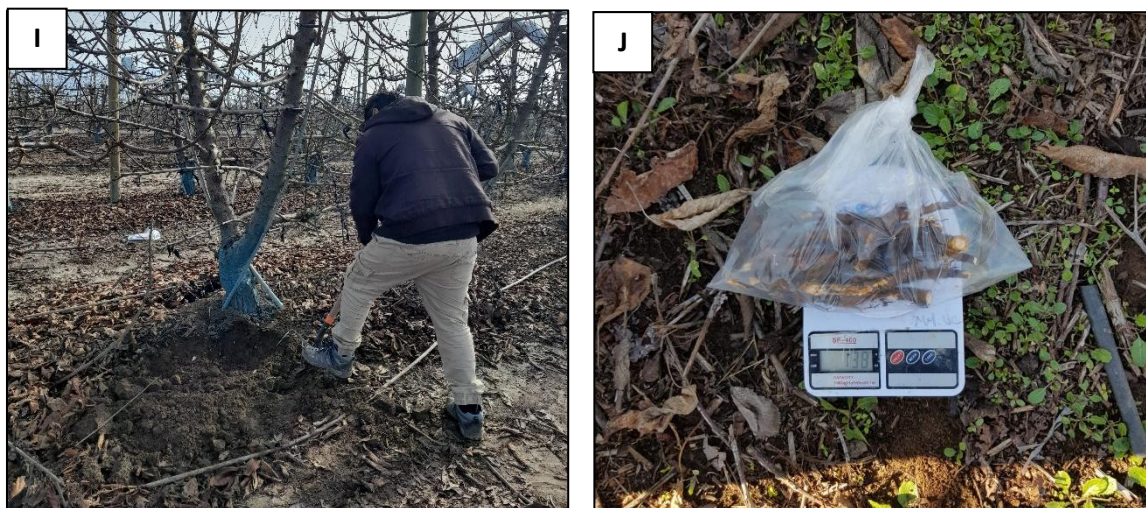
Figura 4. Metodología de aplicación de los tratamientos (A); estado de las raíces al momento de la aplicación “A” realizada el 15-10-2024 (B); estado de las raíces al momento de la aplicación “B” realizada El 28-10-2024 (C); estado de las raíces al momento de la aplicación “C” realizada el 17-01-2025 (D); evaluación de potencial hídrico de tallo (E); conductancia estomática (F); contenido de clorofila (G); toma de muestras de hojas para análisis nutricional (H); toma de muestras de raíces para contenido de arginina (I y J).