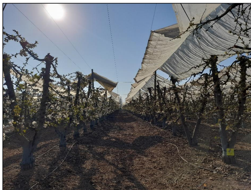
Figura 1. Plantas de cerezo cv. Lapins correspondientes al ensayo.